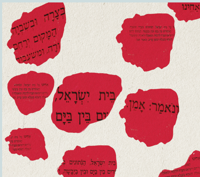
אביעד סגל - שדה כלניות