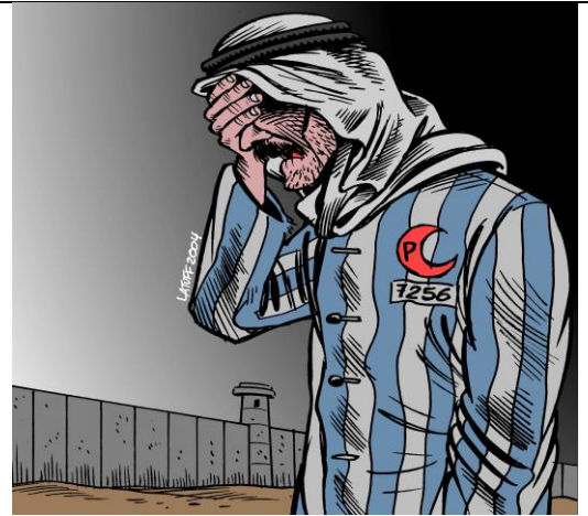
ציור: קרלוס לטוף