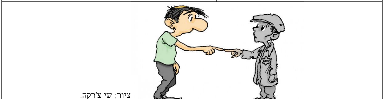
ציור: שי צ'רקה.