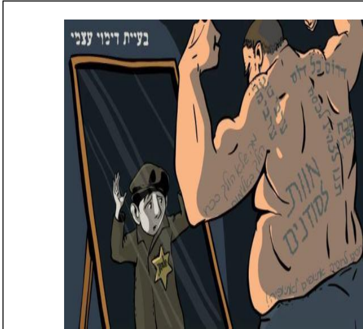
ציור: מיש רוזנוב