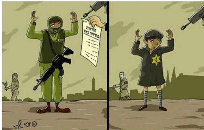
ציור: יוסי שחר